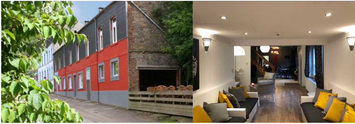
Photos du gîte