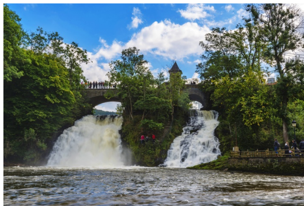
Cascade de Coo

Comme nouvelle option pour ce camp nous partons du côté de la belle commune de Stavelot et plus précisément à Coo, connu pour sa cascade, sa centrale de pompage/turbinage et son parc d'attraction Plopsa Coo. Pour cette année, notre logement sera un gîte au cœur du village. La petite particularité est que nous ne sommes pas seul...En effet, nous nous sommes associés aux guides Horizons de Saint-Guidon (Anderlecht). Nous partagerons ensemble le lieu de camp, les activités ainsi que le projet. Une occasion de découvrir le scoutisme d'une autre façon !